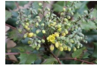
15, ヒイラギナンテン