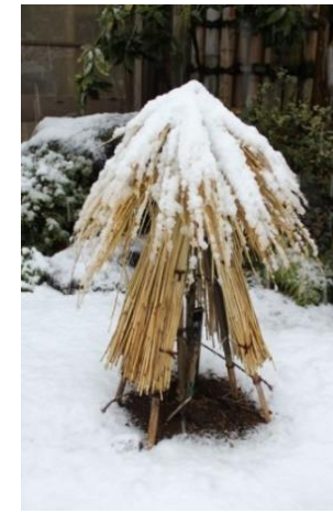
3, ボタン(わらぼっち)