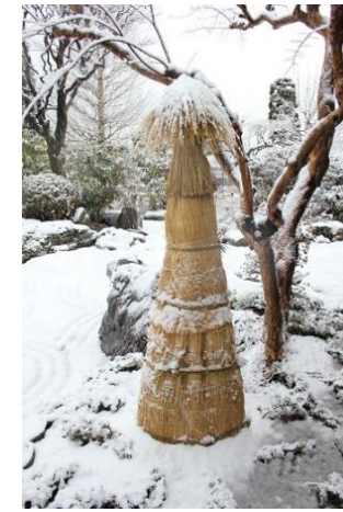
4, ソテツ(わらぼっち)