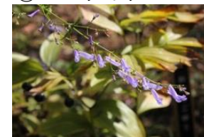
㉑ セキヤノアキチョウジ